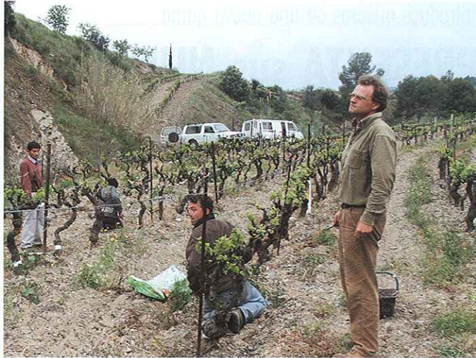
2.- Vista general.

Generalmente, en las tareas de injertado y sobre-injertado, es vital realizar una correcta limpieza de la cepa para asegurar el éxito de la operación. Por ello, entre los servicios de la empresa, se