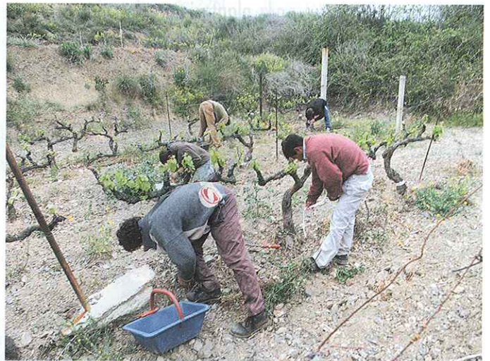
1.- Equipo de World Wide Wine trabajando.

Actualmente, World Wide Vineyards es el líder europeo