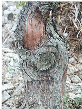
3.- Se limpia la zona del tronco donde se realizará el injerto.