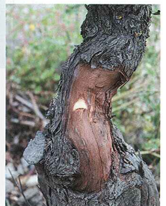
5.- Corte practicado en el patrón que recibirá la púa de injerto “TBud”.