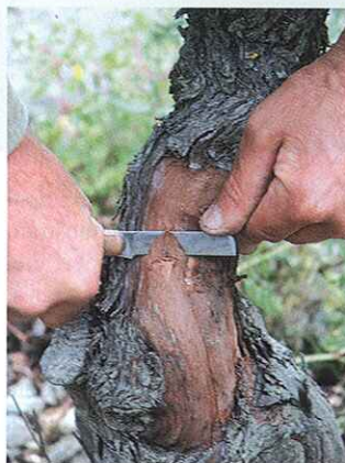
4.- Operaciones para el injerto “TBud”.