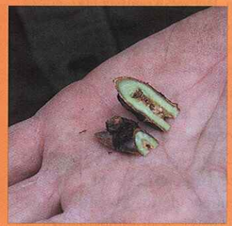
6.- Preparación de la púa para injertar (injerto "TBud").