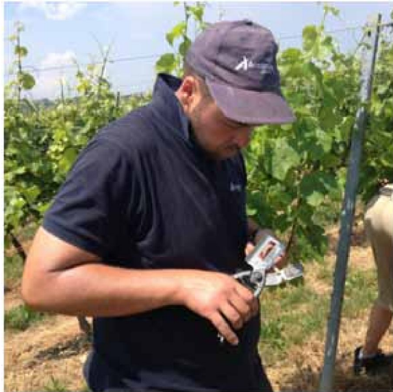
1- Préparation du greffon