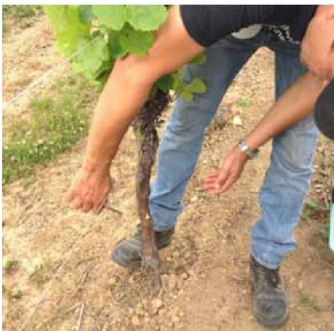
2- Greffage Chip-bud