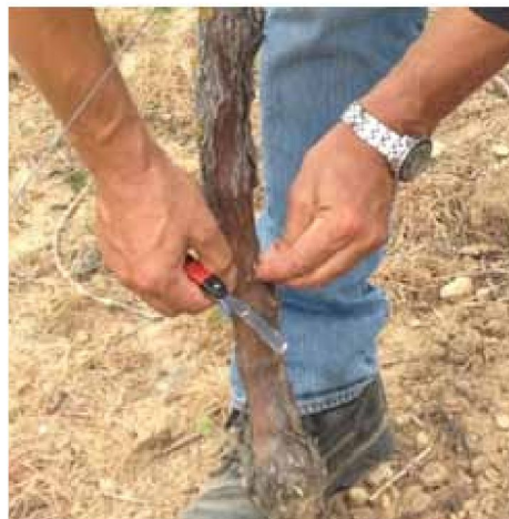
3- Insertion du greffon