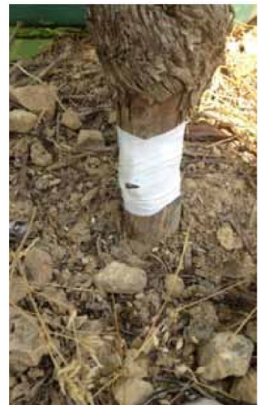
4- Ligature de la greffe